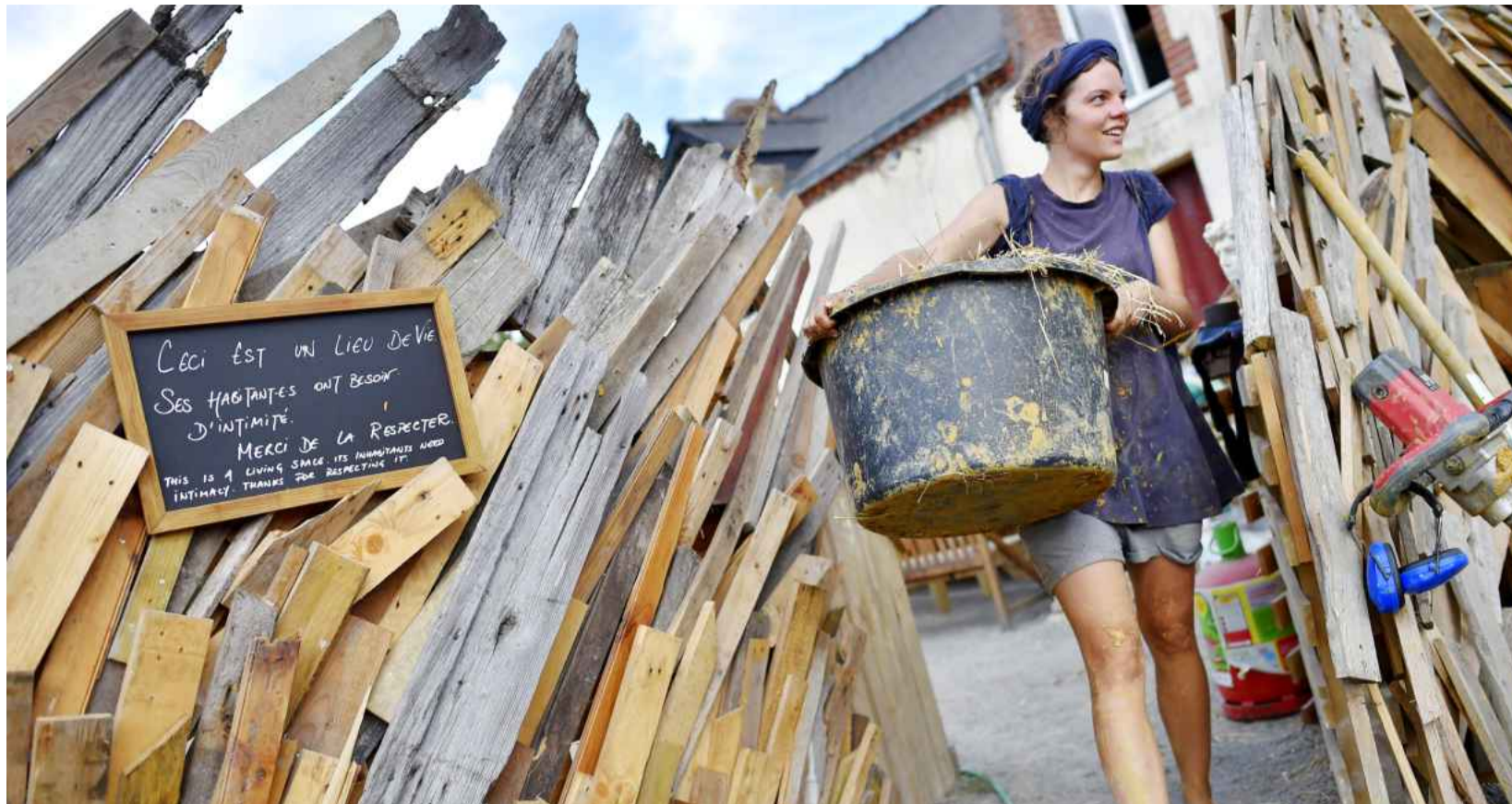
Gemeinsam bauen und kollektiv wirtschaften auf der »Zone à défendre«, kurz ZAD ist der Zentralregierung ein Dorn im Auge.

»Die Internationale erkämpft das Menschenrecht«, heißt es im Refrain des wohlbekanntesten Kampfliedes der Arbeiter*innenbewegung. Damals kämpften Proletarier*innen darum, überhaupt als Menschen, die eigene Rechte haben, anerkannt zu werden. Doch spätestens nach der Oktoberrevolution wurde die Frage relevant, wie es denn eine Linke mit den Menschenrechten hält, wenn sie Macht hat. Im Kalten Krieg wurden die Menschenrechte als Waffe gegen autoritäre Sozialismenmodelle benutzt und oft instrumentalisiert. Der Westen inszenierte sich als Hüter der Menschenrechte, hatte oft keine Probleme, mit Faschisten zu paktieren oder wie in Vietnam Krieg mit Napalm zu führen. Die außerparlamentarische Linke bleibt von der Debatte um die Menschenrechte nicht verschont. Feministinnen erinnerten nach 1968 daran, dass die Menschenrechte nicht geschlechtsblind sind. Antifaschist*innen müssen bei ihren Aktionen berücksichtigen, dass auch Neonazis Menschenrechte haben. Für innerlinke Konflikte sorgte in den vergangenen Jahren zunehmend die Positionierung zu Kriegen, die im Namen der Menschenrechte geführt werden. Während manche Linke angesichts von regressiven Ideologien wie den Islamismus ein bloßes Nein zu einfach finden, betonen andere Linke, dass jeder Krieg per se eine Menschenrechtsverletzung darstellt. now