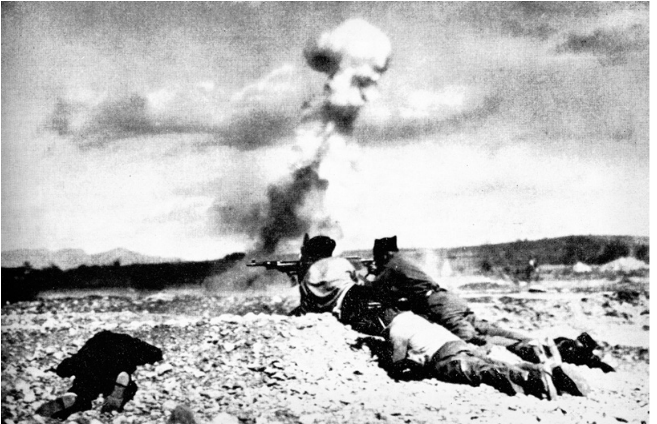
Die Abwehrkämpfe in der hügeligen Landschaft im Süden Madrids waren vor allem für die Internationalen Brigaden schwer und verlustreich – aber zunächst konnte die Front gehalten werden

Eine völlig unbekannte Brücke erlangte plötzlich Weltruhm. Sie war weder eine außergewöhnliche Ingenieurleistung noch besonders schön oder groß. Die Brücke von Arganda del Rey war eine einfache auf Betonpfeilern ruhende Stahlkonstruktion aus dem Jahre 1910. Militärisch gesehen hatte dieser Übergang über den Fluss Jarama südöstlich von Madrid aber eine strategische Bedeutung für den Kampf der Spanischen Republik gegen die putschenden, vom deutschen und italienischen Faschismus unterstützten Generäle.