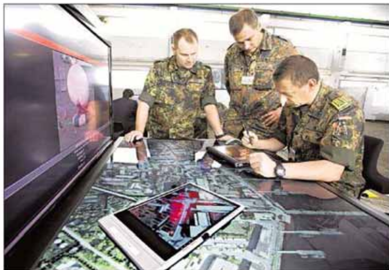
ALLES IM BLICK: Für optimale Einsätze ist es der Bundeswehr wichtig, sich einen realistischen Überblick über die Lage verschaffen zu können. Bei einem Nato-Experiment zur Erprobung neuester Technologien war der digitale Lagetisch des Karlsruher IITB bereits erfolgreich im Einsatz.

Karlsruher IITB entwickelt künstliche Augen der Zukunft / Mini-Blechkerle als Nachtwächter